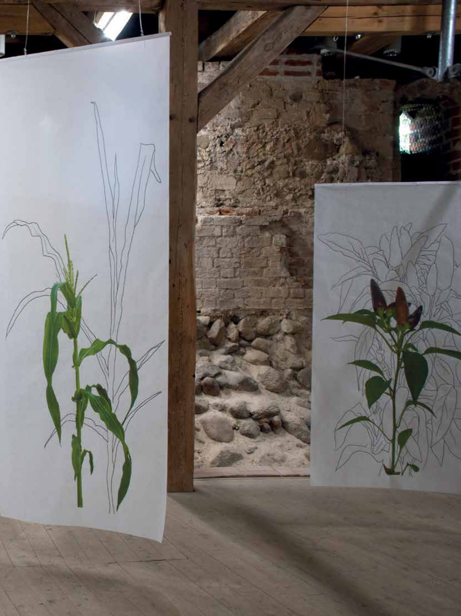
View of the exhibition in the hall of the Klempenow castle