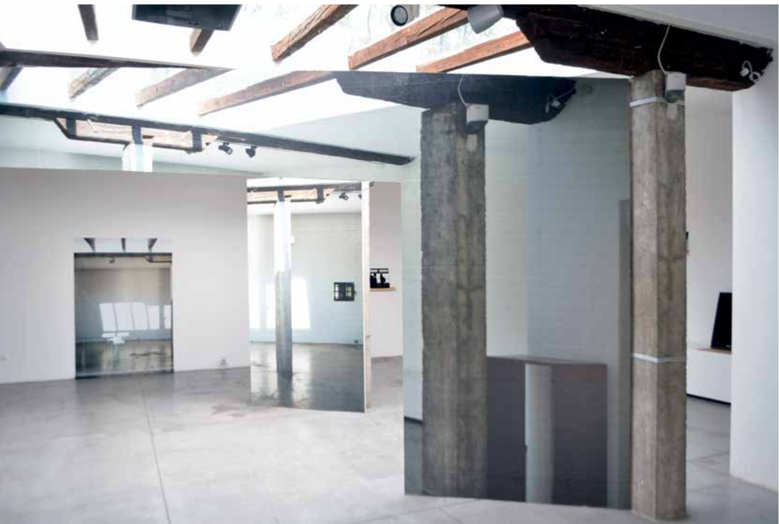
Ansicht der Ausstellung "There Is Always a Story", Galerie Kranjčar, Zagreb, 2019