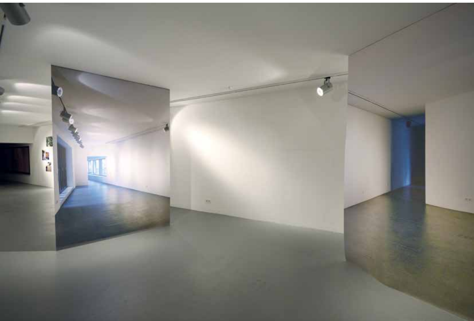
Ansicht der Ausstellung My Voice Will Go With You , Kunstverein am Rosa-Luxemburg-Platz, Berlin, 2019

View of the exhibition My Voice Will Go With You , Kunstverein am Rosa-Luxemburg-Platz, Berlin, 2019