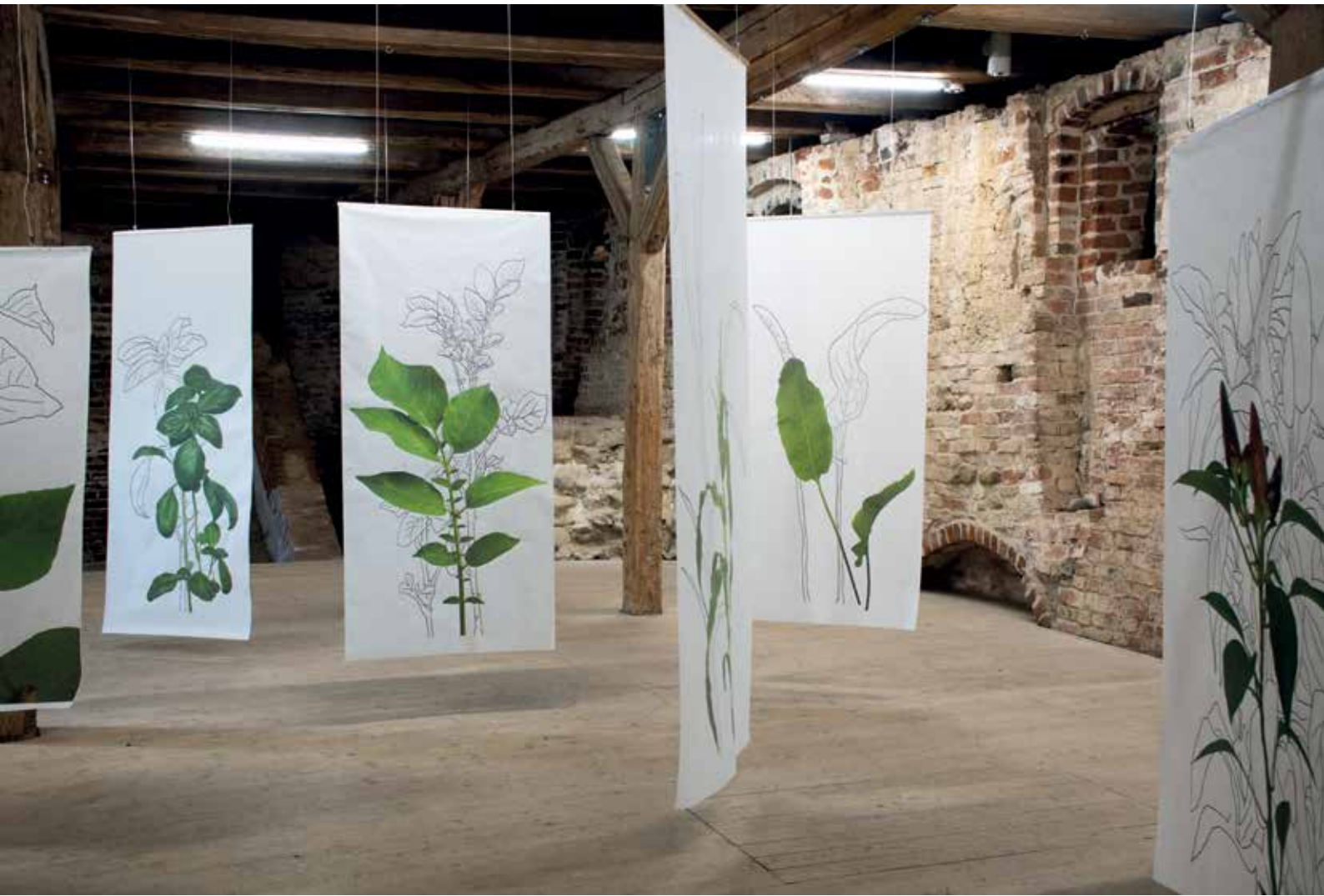
Oben Ansicht der Ausstellung im Burgsaal Klempenow Links Detail (Kartoffel)