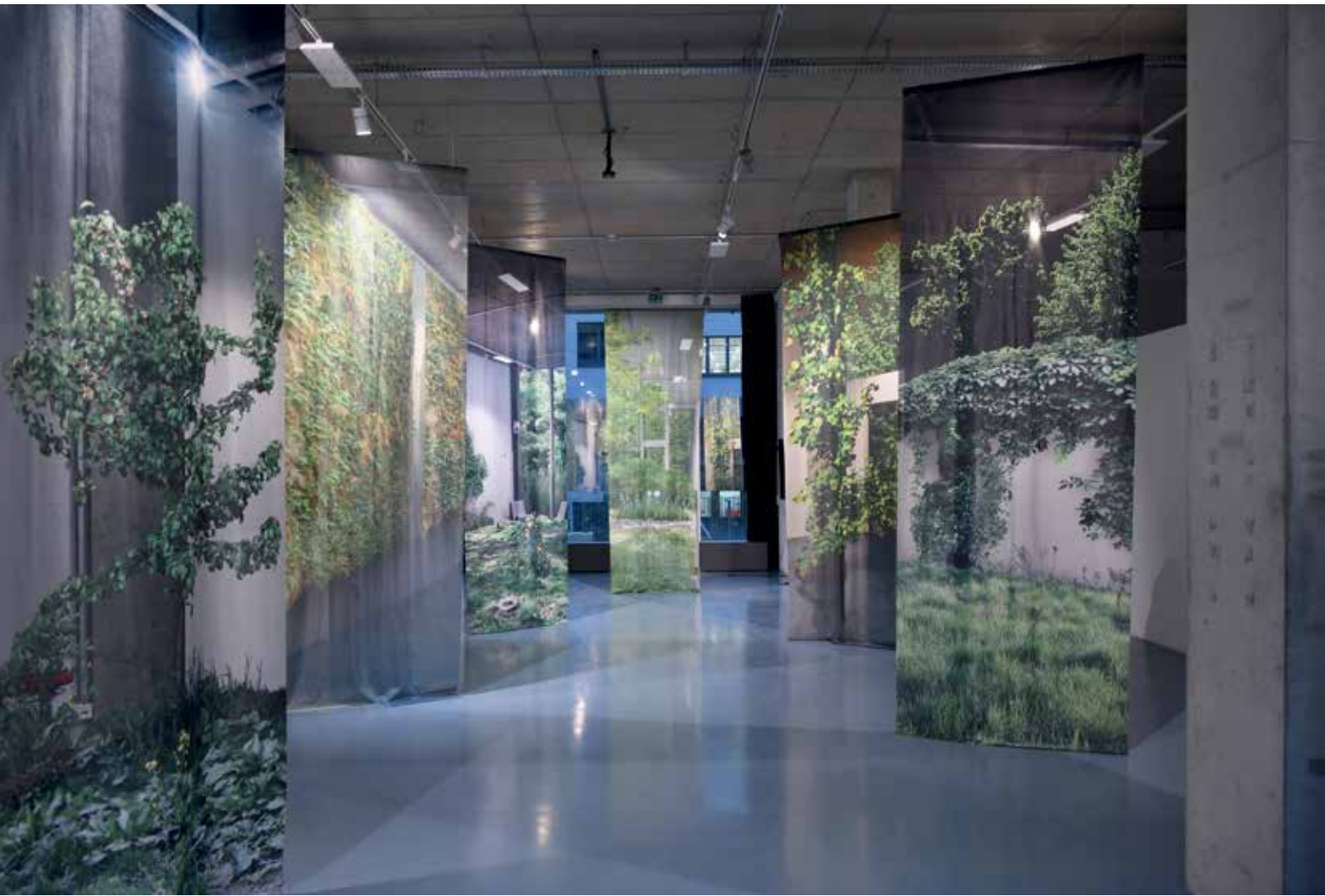
Zwei Ansichten der Ausstellung Alles war grün im CLB, Berlin, 2022