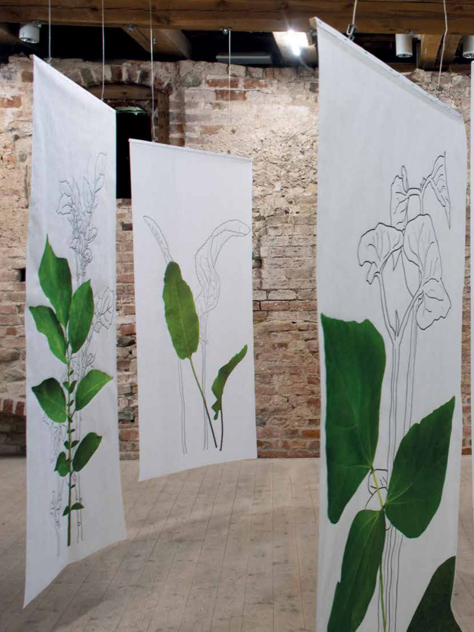
Ansicht der Ausstellung im Burgsaal Klempenow